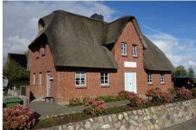
Das Doppelhaus "Golfoase"

Die Unterkunft verteilt sich über EG, 1.OG und DG.