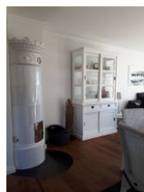
Wohnbereich mit Kaminofen