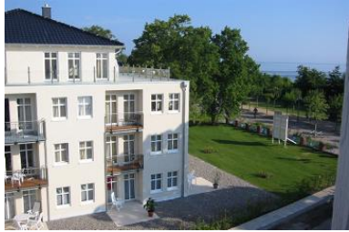
Hausansicht "Villa Aquamarina" von der Südseite (Nachbarhaus)