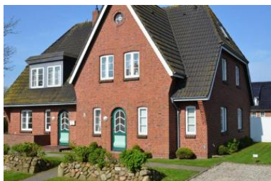
Das schöne Haus von außen.

für 2 Personen - ca. 60m 2 Borgsum, Süüderwoi 8