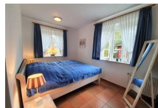
Das komfortable Schlafzimmer.