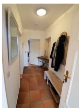
Der kleine Flur.