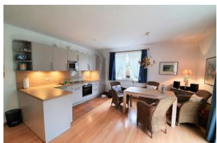
Die offene Küche mit einladendem Sitzplatz.