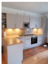
Die gut ausgestattete Küche.