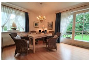
Der geräumige Essbereich.