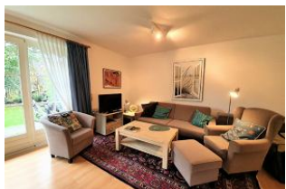
Das gemütliche Wohnzimmer.

In einer ruhigen Sackgasse liegt diese Ferienwohnung im EG eines 4-Parteienhauses. Die Unterkunft verfügt über ein sehr gemütliches und großzügiges Wohnzimmer mit einem Ausgang auf die Terrasse und in den sichtgeschützten Garten mit Strandkorb. Das Schlafzimmer ist mit einem Doppelbett ausgestattet. Die offene und moderne Küche ist voll ausgestattet und lässt keine Wünsche offen. Das Duschbad ist hell und freundlich. Die Wohnung wurde mit viel Liebe zum Detail eingerichtet und ist der ideale Ort zum Entschleunigen.