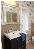
Das Duschbad im Erdgeschoß, hier das Handwaschbecken; nicht im Bild, die Toilette