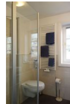
Handtuchwärmer und Toilette