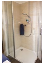
...die Dusche mit flachem Einstieg