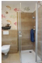
Die Dusche im Bad im Erdgeschoß