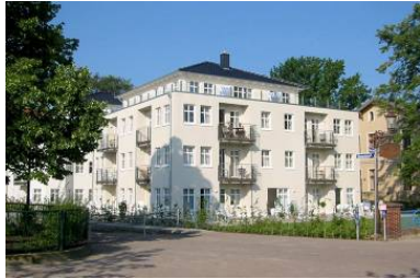
Hausansicht "Villa Aquamarina" von der Promenade