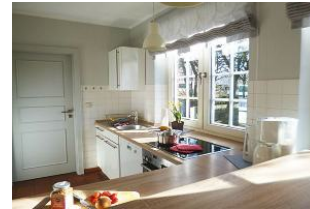
Die Komfortküche mit Geschirrspüler, Backofen, Tiefkühler und Mikrowelle ist reichhaltig ausgestattet.