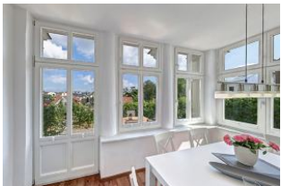
Essplatz in verglaster Veranda

Schicke 4-Zimmer-Wohnung mit Veranda und Terrasse - mit schönem weitem Blick! Die Wohnung ist elegant im Altbau-Stil eingerichtet und komfortabel ausgestattet. Sie wurde 2016 komplett renoviert mit Fußbodenheizung. Die Wohnung verfügt über drei separate Schlafzimmer, jeweils mit zugehörigem ensuite-Bad, Wohnzimmer mit Küchenzeile und Essplatz in der Veranda. Von den drei Bädern sind zwei Duschbäder und eines ein Wannenbad. Die Wohnung verfügt weiter über einen Eingangsflur mit Garderobe. Aus der Veranda gelangt man auf die möblierte Terrasse und in den Garten. Ein Pkw-Stellplatz ist inklusive, ein zweiter Parkplatz kann hinzugemietet werden. Die Villa Margarete steht etwas erhöht in der Bergstrasse, wodurch sich ein schöner Blick ergibt. Die Wohnung befindet sich im EG, etwa 300m zur Strandpromenade. Zum Ortszentrum und der bekannten Ahlbecker Seebücke sind es ca. 8-10 Minuten zu Fuß.