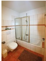
Das größere Duschbad befindet sich im UG ....