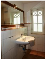
... im EG.