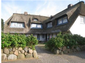
Das Eckhus im Hochstieg 22

Die Unterkunft verteilt sich über EG, 1.OG und DG.