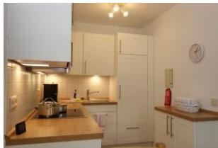
...die neue 03/2022 Einbauküche