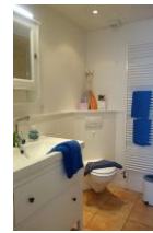
Das Badezimmer im Obergeschoß mit.....