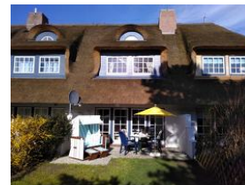
Die Terrasse bei herrlichem Wetter.....