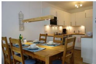
Der Große Esstisch hat für Jeden ein Plätzchen. Im Hintergrund die Küche.