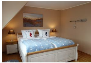
....noch einmal das Bett.