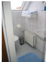
Das Badezimmer mit Dusche