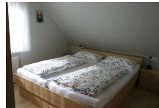
Das freundliche Schlafzimmer bietet erholsamen Schlaf in dem ruhigen Örtchen Utersum.