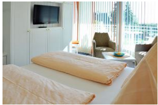
Helles wohnen . . .

Schönes und komfortables Doppelzimmer mit Süd - Balkon und Meerblick. Genießen Sie den einmaligen Blick nach Süden auf die Nordsee und die Halligen. Bitte beachten Sie unsere Sonder - Arrangements.