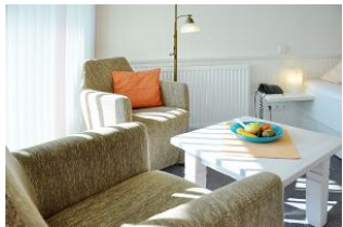
. . . gemütlich . . .