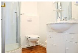
. . . und noch einen Blick ins Badezimmer