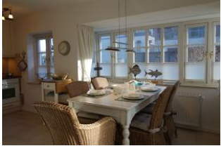
...nehmen Sie Platz, Essen kommt gleich ....