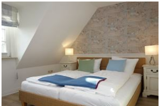
Großes Doppelbett im Elternschlafzimmer 180x200 ohne Fussteil