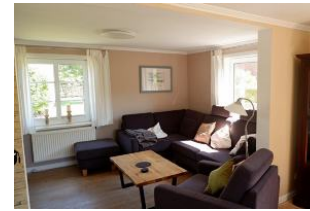
Wohnbereich im Erdgeschoss