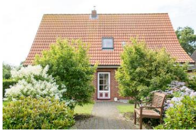
Aussenansicht, Hus Utersum

Die Unterkunft verteilt sich über EG und 1.OG.