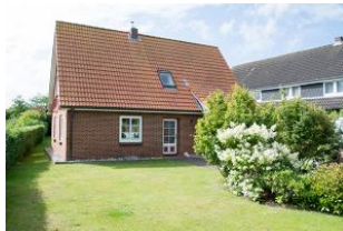
Aussenansicht vorne Hus Utersum