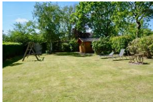
Garten mit Schaukel

Sind Sie reif für die Insel? Haben Sie lust die Seele einmal richtig baumeln zu lassen? Dann sind Sie in diesem Haus genau richtig!