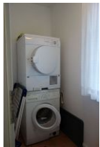
Im Hauswirtschaftsraum zur kostenfreien Nutzung; Waschmaschine und Trockner.