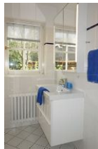
Das Bad mit Handwaschbecken, Toilette und .....