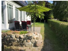
Ein herrlicher Terrassenplatz vom Wohnzimmer aus zu begehen.