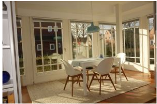
Der herrliche Wintergarten mit dem großen Essplatz....