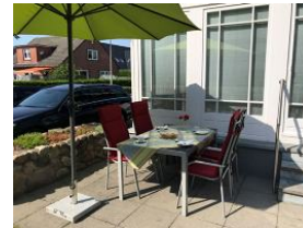
...nehmen Sie Platz, hier gibts Kuchen.....(nicht im Angebot enthalten)