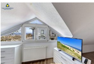
Flachbild TV im Schlafzimmer