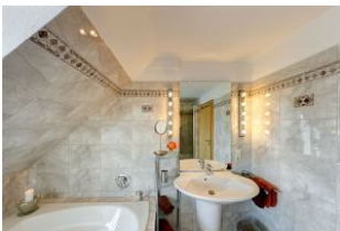
Bad mit Whirl-Badewanne und großer Dusche