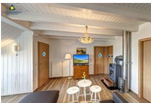
Wohnraum mit Kaminofen