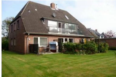
Die Unterkunft befindet sich im 1.OG.

Lust auf Nordsee und Föhr? Unsere Ferienwohnung auf Föhr liegt am Goting Kliff. Sie können bequem zu Fuß oder per Fahrrad zum Strand oder nach Nieblum. Haus Severin ist ein Haus mit 4 Ferienwohnungen.