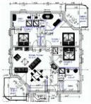
Wohnungsgrundriss (Möblierung exemplarisch)

STRANDNAH, GROSS, MODERN! Mit 2 BALKONEN (je ca. 11 qm), FAHRSTUHL, SAUNA und nur ca. 100 m zur STRANDPROMENADE! Großzügige elegante 4 - Zimmer - Wohnung mit sehr guter Ausstattung! 3 separate Schlafzimmer, 3 Bäder (2 davon ensuite), alle mit Fußbodenheizung. Die ensuite-Bäder verfügen über Wanne und Dusche bzw. Dusche. Das dritte Bad ist ein Saunabad mit Saunakabine und Schwalldusche. Der große Wohnbereich verfügt über eine vollausgestattete Küchenzeile, einen Eßbereich und einen Couchbereich mit KAMINOFEN. Die Balkone sind möbliert. Zur Wohnung gehört ein STRANDKORB AM STRAND. Die Wohnung verfügt über einen Pkw-Stellplatz in der teilüberdachten Tiefgarage. Fahrradabstellfläche ist vorhanden. Vom Haus aus können Sie das Ortszentrum und die bekannte Ahlbecker Seebücke in ca. 2 Minuten zu Fuß erreichen.