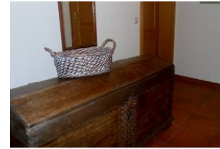
Eingangsbereich in die Wohnung