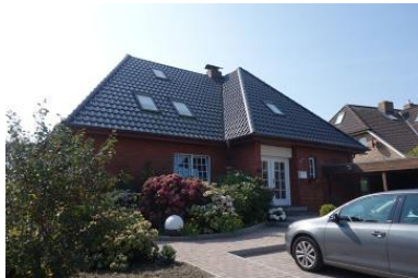
Die Außenansicht des Hauses Baben Döörp 13 in Wyk Boldixum