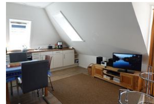
Das TV Gerät