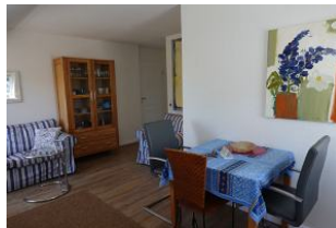
Ein Essplatz darf natürlich auch nicht fehlen