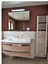
Das große Badezimmer ...