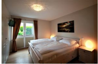
Das große Schlafzimmer mit Doppelbett ...