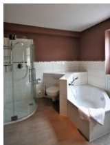
... mit Dusche und Badewanne