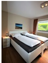
Das zweite Schlafzimmer mit zwei Einzelbetten ...