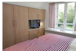
...und TV Gerät, großem Kleiderschrank