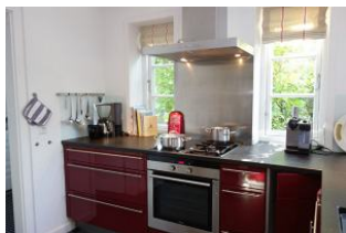
Die offene Küche mit Kochstelle E und Gas