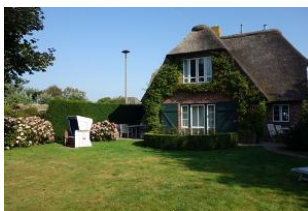
...großer Garten mit Strandkorb