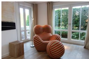
...mit einem spannenden Buch, doch Vorsicht, aus diesem Sessel mag man gar nicht mehr aufstehen...