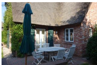
...und Terrasse 2