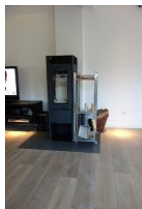
...ein gemütlicher Abend am Ofen ???