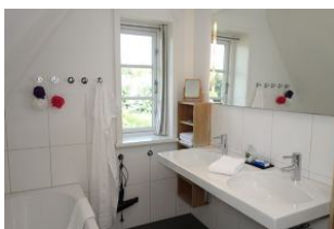
Das Bad im OG mit Doppelwaschtisch....