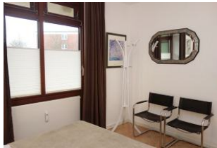
Stühle und Spiegel im Schlafzimmer