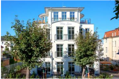
Hausansicht aus der Architektenplanung