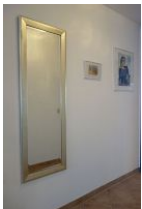
...noch ein letzter Blick in den großen Spiegel...