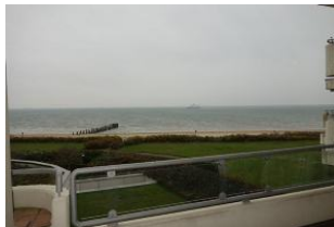
Der winterliche Blick aufs Meer