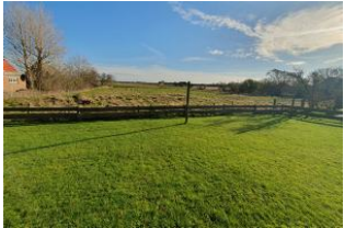
Ihr kleiner Garten.