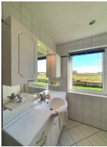
...mit Blick auf die Salzwiesen.