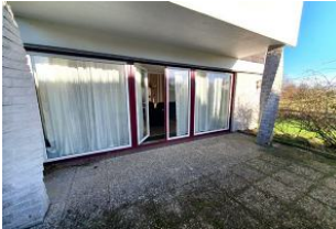
Die Terrasse der Wohnung.

Waschmaschine und Trockner stehen für unsere Gäste bereit.