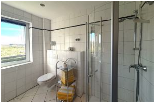
Das helle Duschbad...