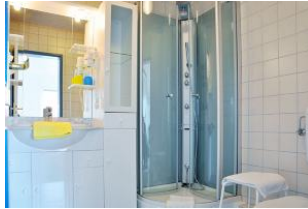
... und noch einen Blick ins Badezimmer