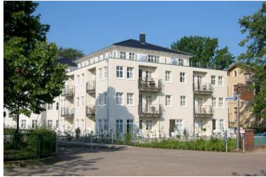
Hausansicht "Villa Aquamarina" von der Promenade