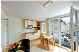
Küche mit Esszimmer

Direkt an der Strandpromenade mit SÜDBALKON und FAHRSTUHL im Haus! Schönes geräumiges 2-Zimmer-Apartment mit geschmackvoller guter Ausstattung. Separates Schlafzimmer (mit Fernseher), Wohnzimmer mit Küchenzeile und Essplatz, Duschbad, Balkon nach Süden mit Sonne bis abends. Die Wohnung verfügt über einen Tiefgaragen-Pkw-Stellplatz. In der Garage können auch Fahrräder und ähnliches untergestellt werden. In unserer "Villa Germania" nebenan gibt es eine Sauna. Von der "Villa Aquamarina" aus können Sie das Ortszentrum und die bekannte Ahlbecker Seebrücke in ca. 3 Minuten zu Fuß erreichen. Zum Strand sind es 50 m.