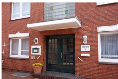
Das Haus Teunis in der Mühlenstrasse 9 / Ecke Carl - Häberlin - Strasse