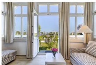
Veranda mit direktem Gartenzugang und dortiger Terrasse