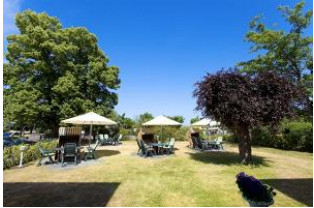
Garten mit Terrassen und Strandkörben (Mai bis September)