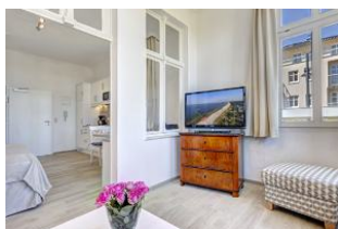
Veranda mit Blick zur Küchenzeile