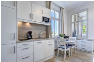
Küchenzeile und Essbereich