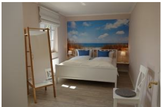
Das Elternschlafzimmer mit Nordseefeeing ....