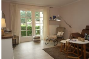
...hier noch einmal das Wohnzimmer..