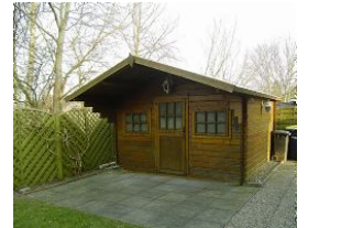
Im Gartenhäuschen können Sie Ihre Fahrräder unterstellen.