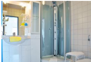
... und noch einen Blick ins Badezimmer