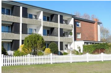
Das Matthias-Petersen-Haus von außen.