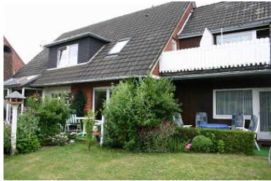
Das Haus "Pidder Lyng" mit den insgesamt 5 Wohneinheiten.