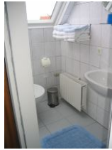
Das Badezimmer mit Dusche