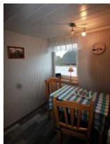
Die gemütliche Sitzecke in der Küche.