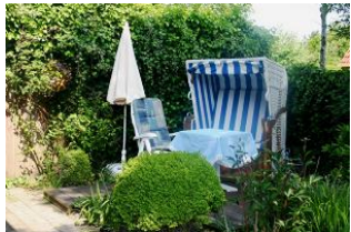
Zur Ferienwohnung gehört diese schöne Sitzecke mit Strandkorb im gemeinschaftlichen Garten.

Das Haus "Pidder Lyng" - gelegen in Utersum - bietet Ihnen alles, was Sie sich für einen erholsamen Urlaub wünschen können. Das Dorfzentrum befindet sich nur 800 Meter entfernt und der schönste Strand der Insel ist in wenigen Gehminuten erreichbar. Die helle, sonnige Dachgeschosswohnung verfügt über alles, was man sich für einen entspannten Urlaub wünscht. Angefangen vom Backofen und Geschirrspüler bis hin zum WLAN-Anschluss und nicht zu vergessen der Sitzecke mit Strandkorb im Garten. Die Eigentümer haben die Wohnung mit viel Liebe zum Detail gemütlich und stilvoll für Sie eingerichtet.