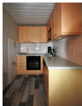
Die separate Küche ist vollausgestattet und verfügt über Backofen, Geschirrspüler und Mikrowelle.