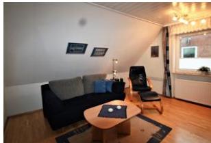
Der gemütliche Wohnbereich lädt zum Ausruhen und Entspannen ein.