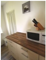
... mit moderner Mikrowelle und viel Platz.