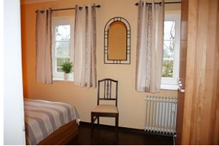
ein großer Schrank für das Urlaubsgepäck ist vorhanden.