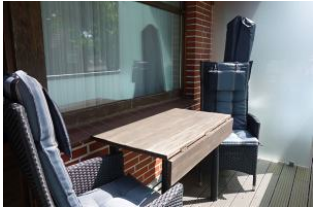
...ein Platz an der Sonne auf dem Balkon