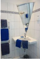
Das Waschbecker mit spezieller Spiegellösung