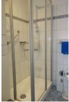
die Duschkabine mißt 90x75, niedrige Duschwanne