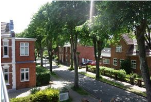
Der Blick entlang der Feldstr. zum Mühlenpark