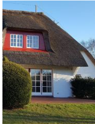
Aussenansicht im Garten aus

Die Unterkunft verteilt sich über UG, EG, 1.OG und 2.OG.