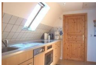
Ihre voll ausgestattete Küche lässt keine Wünsche offen.