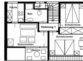
Der Grundriss der Wohnung.