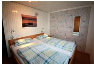
Hier sehen Sie das zweite Schlafzimmer.

Entfernungen, zirka: zum Bäcker 800 m, zur Einkaufsmöglichkeit 800 m, zum Meer 500 m, zum Ortszentrum 800 m