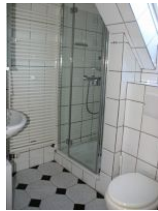
Das Badezimmer mit Dusche.