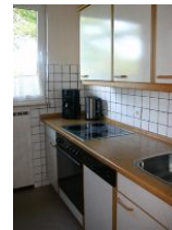
In der separaten, vollausgestatteten Küche mit Backofen, Geschirrspüler und Mikrowelle macht das Kochen richtig Spaß.