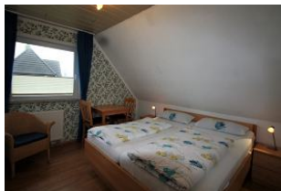
In dem ruhigen und beschaulichen Örtchen Utersum finden Sie in den schönen Schlafräumen einen erholsamen Schlaf.

Entfernungen, zirka: zum Bäcker 800 m, zur Einkaufsmöglichkeit 800 m, zum Meer 500 m, zum Ortszentrum 800 m