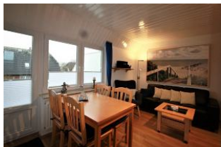
Das gemütliche und helle Wohnzimmer mit der integrierten Essecke lädt zum Verweilen ein.

Das Haus "Pidder Lyng"- gelegen in Utersum - bietet Ihnen alles, was Sie sich für einen erholsamen Urlaub wünschen können. Das Dorfzentrum befindet sich nur 800 Meter entfernt und der schönste Strand der Insel ist in wenigen Gehminuten erreichbar. Die helle und sonnige Ferienwohnung ist eine Dachgeschosswohnung mit Balkon. Durch die zwei Schlafzimmer, dem hellen Wohnraum mit gemütlicher Essecke, der separaten Küche und dem Badezimmer mit Dusche findet sich genügend Platz für einen Urlaub mit 4 Personen. Die hervorragende Ausstattung der Wohnung lässt keine Wünsche offen.