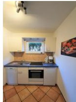
Die kleine aber gut ausgestattete Küche