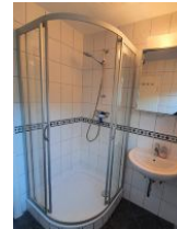
Das kleine Duschbad mit Tageslicht