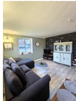
Die moderne Fernsehcke.