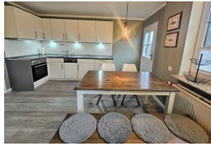
Die neue und helle Kochnische der Ferienwohnung Nis Puk mit Backofen und Geschirrspüler.