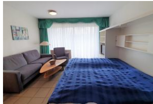
Das Schrankbett bietet Platz für 2 Personen.