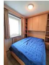
Das Schlafzimmer mit kleinem Doppelbett