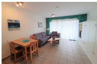
Der Wohnraum mit direktem Ausgang auf die eigene Terrasse.