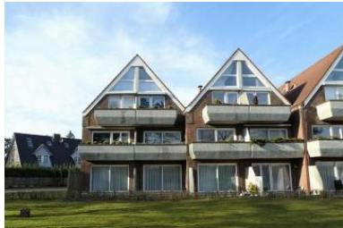
Das Haus von außen