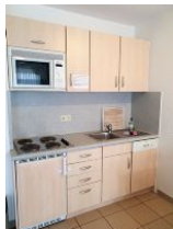
Die Küche ist nicht groß, aber gut ausgestattet.