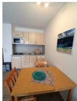
Der Wohnraum mit integrierter Küchenzeile.

Die Ferienwohnung Strandläufer liegt in einer bevorzugten Lage von Wyk . Ruhig und doch zentral , fußläufig zur Promenade, der Innenstadt, dem Wellenbad mit seinen Kureinrichtungen oder zum Südstrand. Die kleine Wohnung ist für bis zu 3 Personen ausgelegt . Sie ist liebevoll ausgestattet und hat ein kleines separates Schlafzimmer mit einem kleinen Doppelbett ( 140/ 190) und einem Schrankbett im Wohnbereich ( 2 X 80 / 190). Der Wohn- Ess- Bereich hat eine offene, voll ausgestattete Küche und einen direkten Ausgang auf die eigene Süd- Terrasse. Sie finden in dieser Wohnung ein modernes Duschbad mit Toilette zur täglichen Hygiene. Hier macht Urlaub Spaß.