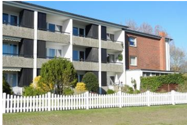
Das Matthias-Petersen-Haus von außen.