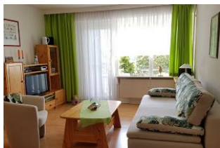
Das gemütliche Wohnzimmer mit direktem Ausgang auf die kleine Terrasse.

Wenn Sie in Ihrem Urlaub Ruhe und gleichzeitig die Nähe zum Strand und ins Zentrum suchen, sind Sie hier im Kapitän-Matthias-Petersen-Haus am Rande von Wyk gut aufgehoben. Das Haus befindet sich in einer ruhigen Wohnlage. Zum Südstrand sind es ca. 10-15 Gehminuten. Die mit viel Liebe zum Detail eingerichtete Zwei-Zimmer-Wohnung (für bis zu 4 Personen) bietet auf ca. 41 m 2 alles für einen angenehmen Urlaub. Sie ist allergikerfreundlich eingerichtet und befindet sich im Erdgeschoss der Wohnanlage.