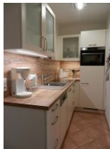
Die gut ausgestattete Küchenzeile.