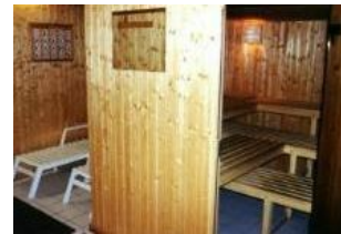
Die kleine Sauna im Keller des Hauses.