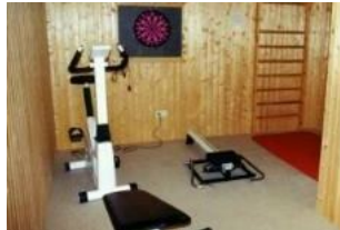
Der kleine Fitnessraum im Keller des Hauses.