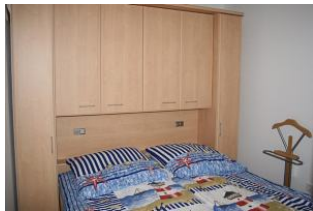
Das Schlafzimmer mit Doppelbett und viel Stauraum für Ihr Urlaubsgepäck.