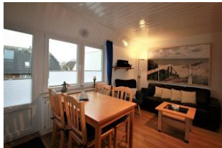
Das gemütliche und helle Wohnzimmer mit der integrierten Essecke lädt zum Verweilen ein.

Das Haus "Pidder Lyng"- gelegen in Utersum - bietet Ihnen alles, was Sie sich für einen erholsamen Urlaub wünschen können. Das Dorfzentrum befindet sich nur 800 Meter entfernt und der schönste Strand der Insel ist in wenigen Gehminuten erreichbar. Die helle und sonnige Ferienwohnung ist eine Dachgeschosswohnung mit Balkon. Durch die zwei Schlafzimmer, dem hellen Wohnraum mit gemütlicher Essecke, der separaten Küche und dem Badezimmer mit Dusche findet sich genügend Platz für einen Urlaub mit 4 Personen. Die hervorragende Ausstattung der Wohnung lässt keine Wünsche offen.