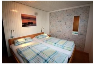
Hier sehen Sie das zweite Schlafzimmer.

Entfernungen, zirka: zum Bäcker 800 m, zur Einkaufsmöglichkeit 800 m, zum Meer 500 m, zum Ortszentrum 800 m