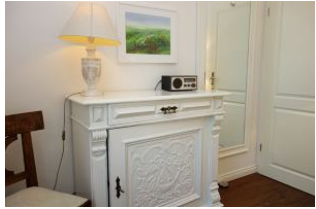
Kommode im Schlafzimmer