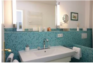
Neues Bad im Erdgeschoß mit türkisfarbenen Mosaikfliesen, großem Waschtisch...