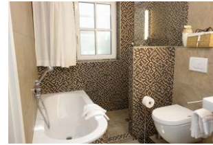
...Badewanne und offene Dusche, Toilette