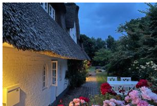
Abendstimmung in Borgsum