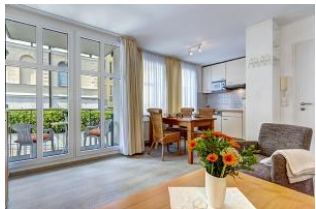
Wohnen, Essen, Küche, Balkon

Direkt an der Strandpromenade mit SÜDBALKON und FAHRSTUHL im Haus! Schönes geräumiges 2-Zimmer-Apartment mit moderner guter Ausstattung. Separates Schlafzimmer (mit Fernseher), Wohnzimmer mit Küchenzeile und Essplatz, Duschbad, Balkon zur Südseite mit Sonne bis abends. Die Wohnung verfügt über einen Tiefgaragen-Pkw-Stellplatz. In der Garage können auch Fahrräder und ähnliches untergestellt werden. Von der "Villa Aquamarina" aus können Sie das Ortszentrum und die bekannte Ahlbecker Seebrücke in ca. 3 Minuten zu Fuß erreichen. Zum Strand sind es 50 m.